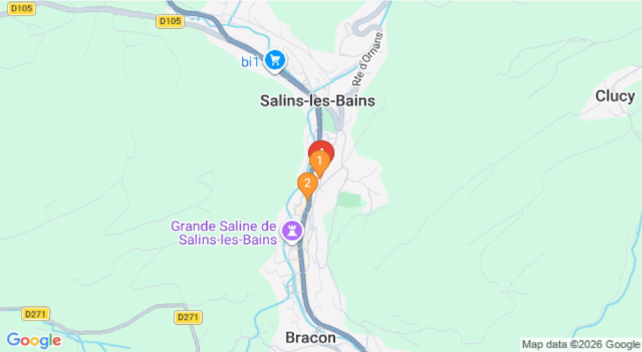
Map data ©2026 Google